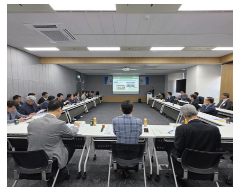
글로벌 댐 기술 및 에너지 전환 (양수발전, 수상태양광) 등 동향 정보 공유