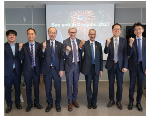
'27년 대전 연차회의 개최 관련 준비 및 추진 현황 점검