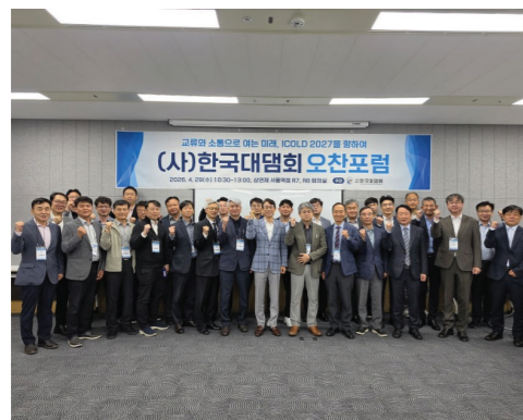
ICOLD2027 대전 연차회의 준비현황 공유, 한국대담회 활성화 토의 및 주요사업 공지 알림