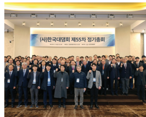
(총회) 회장 및 감사 선출, 예·결산, ICOLD 2027 현황 공유 특별보고