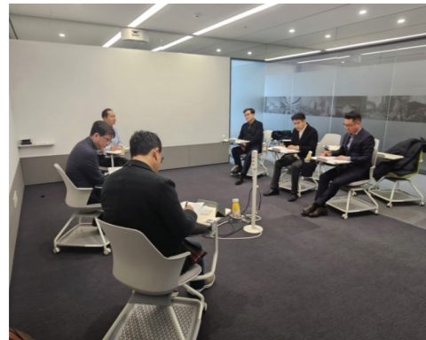
2026년 포상후보자 검토 및 선정