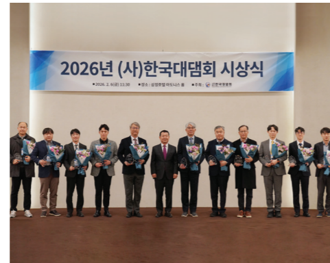
2026년 한국대담회 시상식