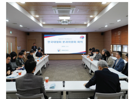
기술투어 프로그램 아이디어 수렴, 한국대담회 운영 활성화 방안에 대한 토의