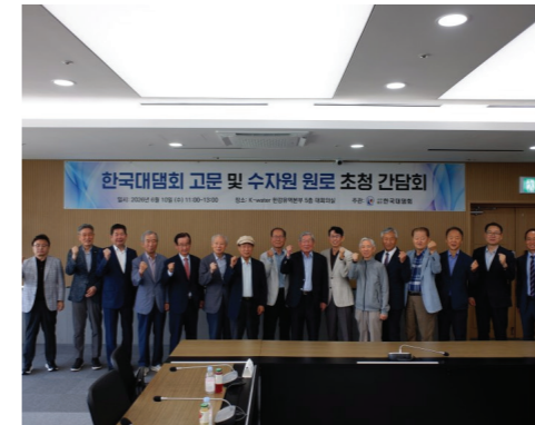
ICOLD 2027 대전 연차회의 준비현황 공유를 위한 한국대담회 고문 및 수자원 원로 초청 간담회