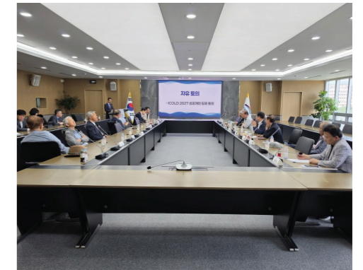
ICOLD 2027 연차회의 성공 개최를 위한 비상대책위 구성 및 콘텐츠, 재원조달, 홍보 전략 등 토의