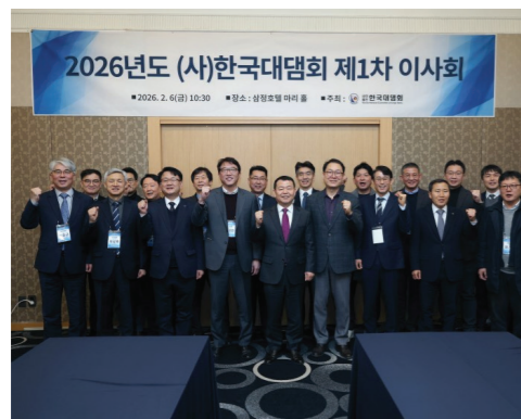
(이사회) 회장 및 감사 선출