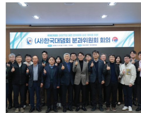
ICOLD2027 대전 연차회의 준비현황 보고, 분과별 심포지엄 소주제 의견 수렴 등