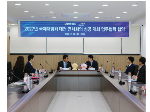
국내외 참가자 증대방안 마련, 임시실 연계 대전 투어 프로그램 기획 등 전반적인 협력체계 구축