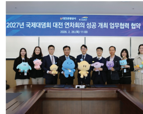
국제대담회 연차회의 성공개최를 위한 대전관광공사·한국수자원공사 업무협력 협약