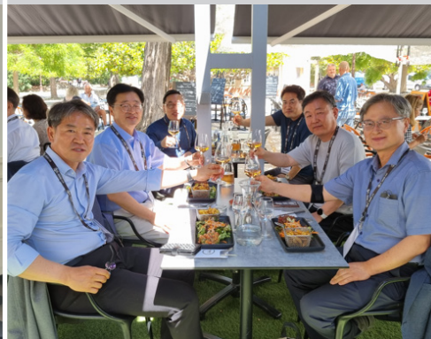
댐 관리 공기업 간담회